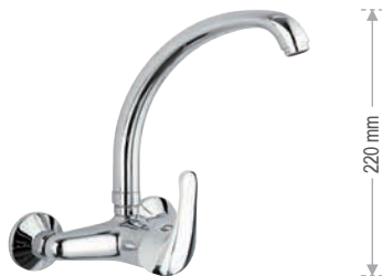
F 43 2 Miscelatore monocomando per lavello a muro, con leva frontale e bocca alta girevole. Single-lever wall mounted sink mixer, with frontal lever and high movable spout.