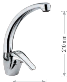
F 42 2 C Miscelatore monocomando per lavello, con bocca alta girevole, modello corto. Single-lever one-hole sink mixer, with high movable spout, shorter model.