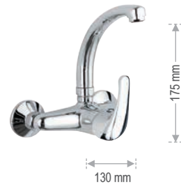
F 43 2 C Miscelatore monocomando per lavello a muro, con leva frontale e bocca alta girevole, modello corto. Single-lever wall mounted sink mixer, with frontal lever and high movable spout, shorter model.