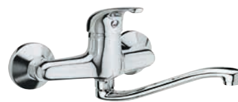
F 41 2 S Miscelatore monocomando per lavello a muro, con bocca a "S" girevole. Single-lever wall mounted sink mixer, with "S" movable spout.