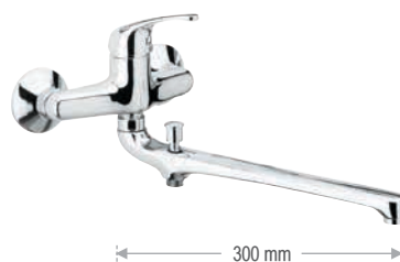
F 46 2 Miscelatore lavabo/vasca con canna fusa lunga 30 cm e deviatore senza kit doccia.

Wall basin/bath single lever mixer with 30 cm long casted spout with diverter without duplex shower.