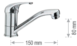
F 11 2 G Miscelatore monocomando per lavabo o lavello, con bocca girevole. Single-lever one-hole basin or sink mixer, with movable spout.