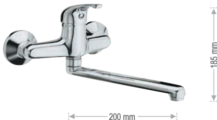
F 41 2 Miscelatore monocomando per lavello a muro, con bocca girevole. Single-lever wall mounted sink mixer, with movable spout.